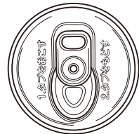
タブがとれにくい方式 (1990年から)